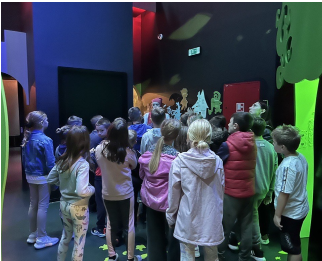
Ogulin (Ivanina kuća)