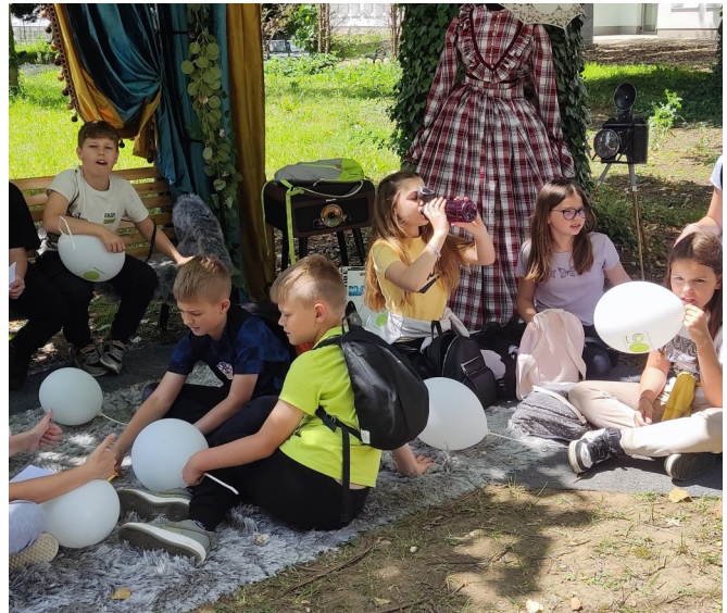
Dan očaranosti biljkama na Agronomskom fakultetu