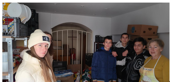
Volonteri u Pučkoj kuhinji