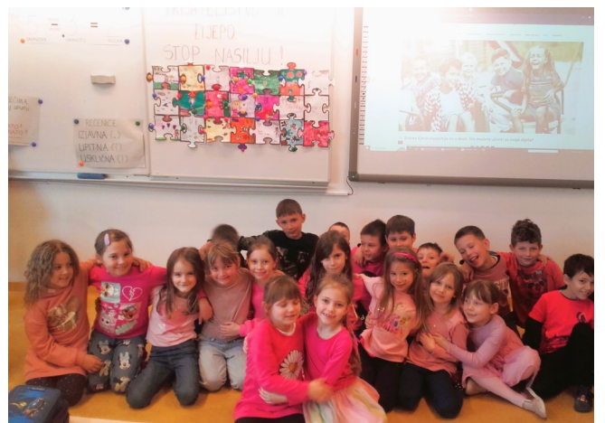
Dan ružičastih majica