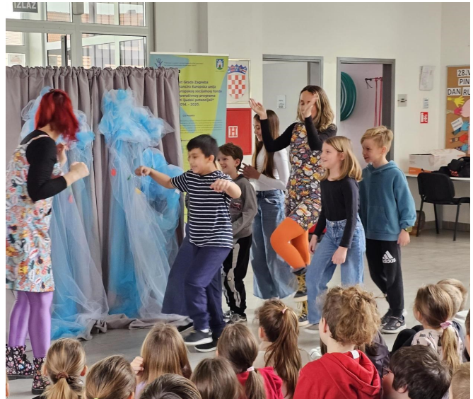
Predstava u školi