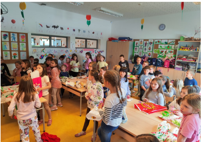
Dan planeta Zemlje (recikliranje plastičnih vrećica)