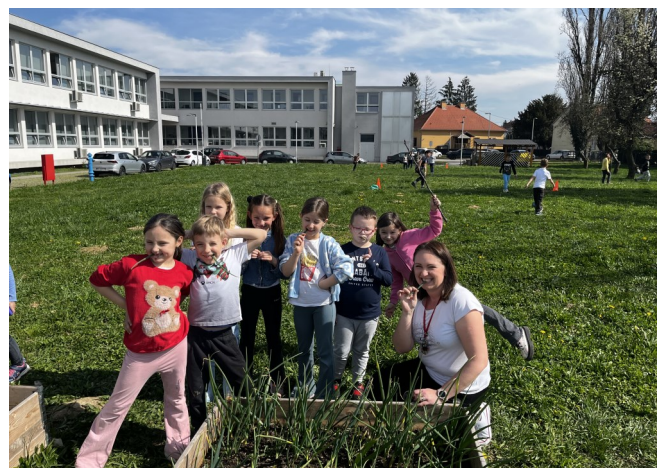
Prvi dan proljeća