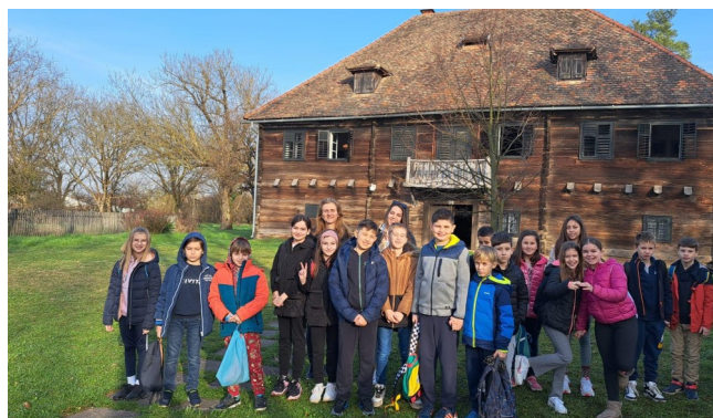
Lepo naše Turopolje