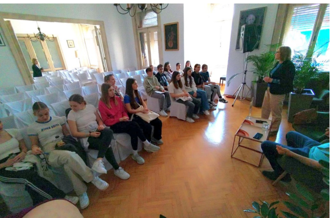
Posjet Društvu hrvatskih književnika